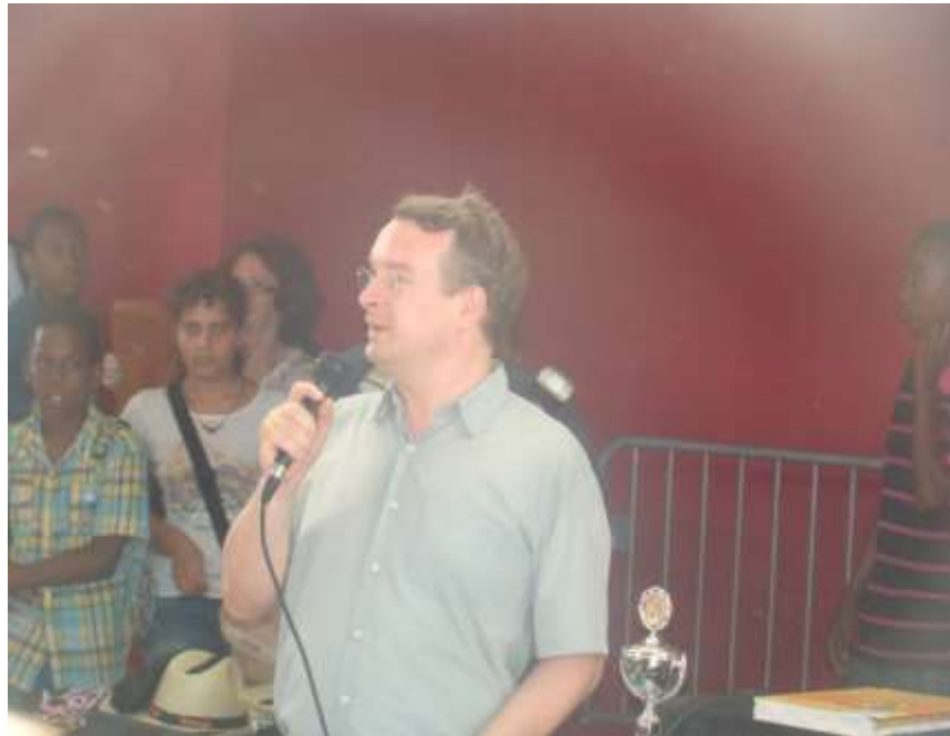
Collège Marthe ROBIN (le Tampon) conserve son titre

16H15 : Remise des prix par le président de la ligue d'échec, qui reconnaît que si les conditions de jeu étaient très bonnes, le niveau de jeu était , lui, très excellent.