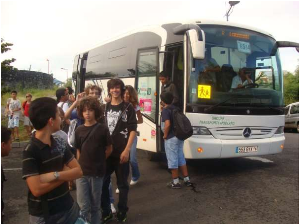
DESCENTE DU BUS 9H00